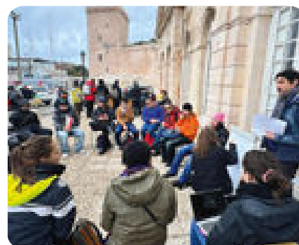
Rencontre publique, à Agde, le 27/03/2024 lors du débat public “la mer en débat”

“ L’objectif de la transition, c’est de faire revenir le paysage de la production dans nos cadres de vie comme technique de responsabilisation par rapport à nos modes de consommation pour rendre à nouveau non-évident le paysage de la consommation.”