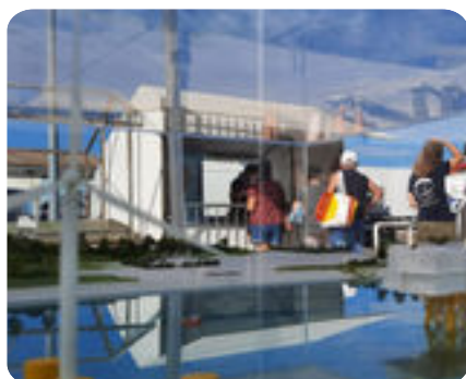
Débat mobile au marché aux poissons de Carro à Martigues, le 16 juillet 2021, lors du débat public “EOS”