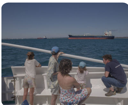
Navigation de Port de Bouc à Port Saint Louis, le 9 juillet 2021, lors du débat public “EOS”